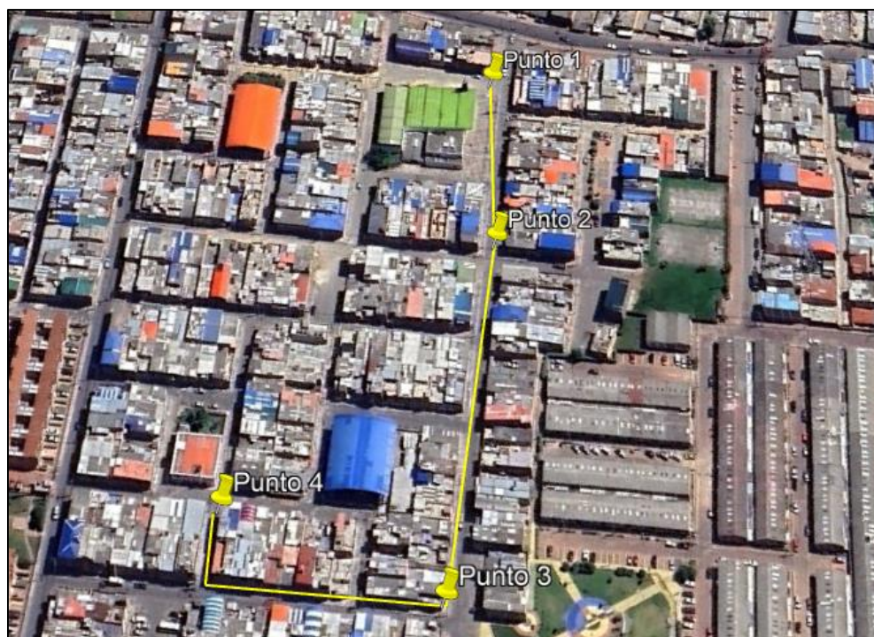
Ilustración 1. Recorrido de verificación ambiental

Se realizó recorrido de control y vigilancia en el cuadrante 2, barrio POPULAR el día 11 de junio del 2024, desde las coordenadas 4°42'29,100"N- 74°12'45,983"W hasta las coordenadas 4°42'27,785"N- 74°12'52,863"W (ver ilustración 1. Ruta amarilla), con el fin de verificar las condiciones ambientales, identificar posibles afectaciones a los recursos naturales y realizar las acciones de prevención correspondientes.