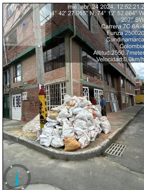
Ilustración 2. Residuos encontrados el 24 de abril de 2024

C.P.250020 Tel. +57(1) 823 40 70 823 40 71 / 823 40 73 Fax. + 57(1) 825 76 20 Dir. Cra. 14 No. 13-05