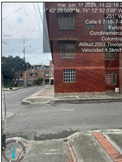
Ilustración 3. Evidencias recorrido